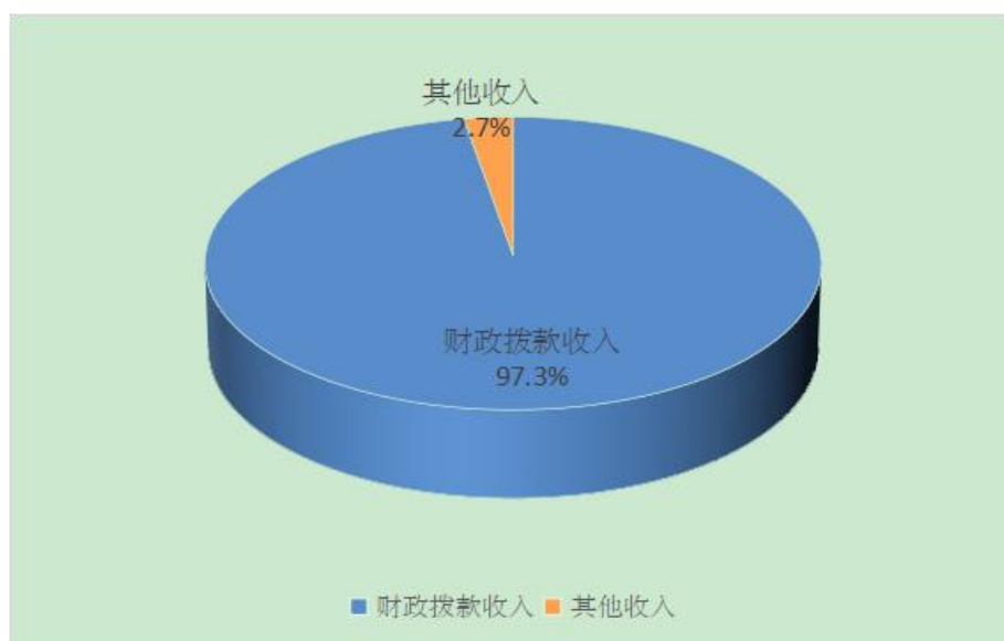
图 2：收入决算结构（比例）